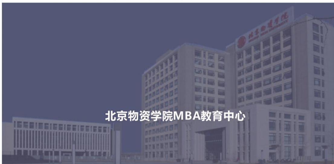
北京物资学院MBA教育中心